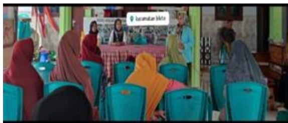
Gambar 1. Edukasi kepada ibu hamil di Posyandu

Kegiatan edukasi diberikan melalui penyuluhan interaktif menggunakan media visual serta diskusi kelompok untuk menjelaskan penyebab, jenis ketidaknyamanan umum, dan strategi penatalaksanaannya. Pendekatan ini dirancang agar peserta lebih mudah memahami dan menerapkan materi yang diberikan